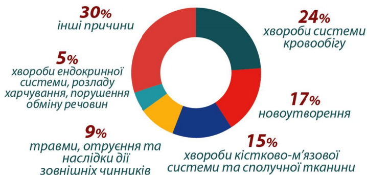
Розподіл осіб за причинами інвалідності

112,1 тис. осіб отримують пенсію за інвалідністю