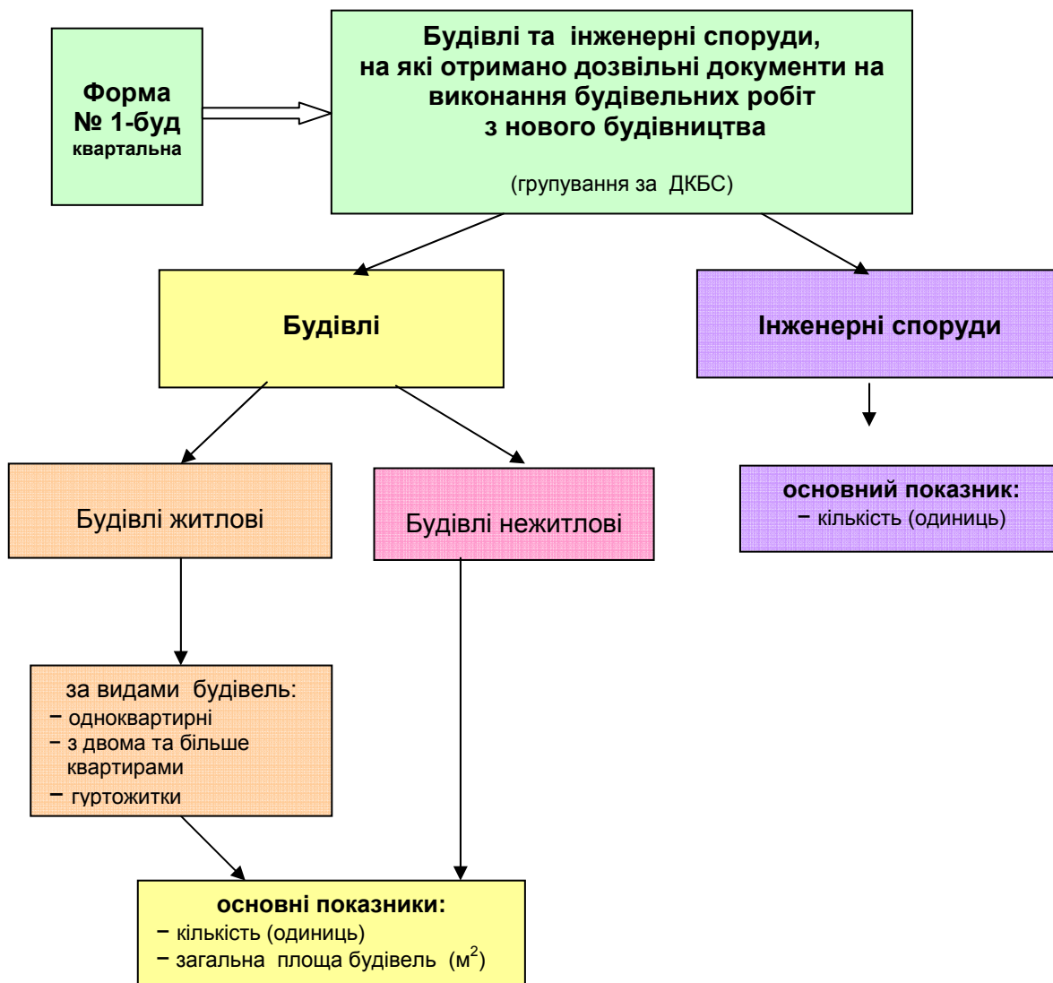
Схема 1. Показники дозволів на будівництво