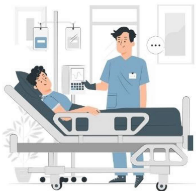
Кількість лікарняних ліжок, тис. 34,3

17,6 тис. середнього медичного персоналу